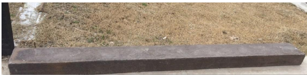
Durmiente de plástico reciclado fabricado experimentalmente en Argentina.

El plástico una vez más, puede contribuir a innovaciones tecnológicas, pero para ello es necesario que no se disponga en rellenos sanitarios, y que los ciudadanos los separemos en el hogar para su posterior reciclado.