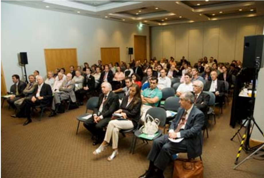
Asistentes al Seminario Internacional Sustentabilidad de los Plásticos. Su contribución al cuidado ambiental