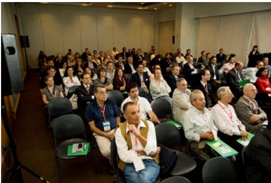
Asistentes al Seminario Internacional Sustentabilidad de los Plásticos. Su contribución al cuidado ambiental