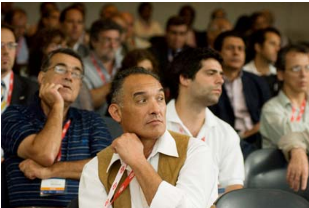
Asistentes al Seminario Internacional Sustentabilidad de los Plásticos. Su contribución al cuidado ambiental