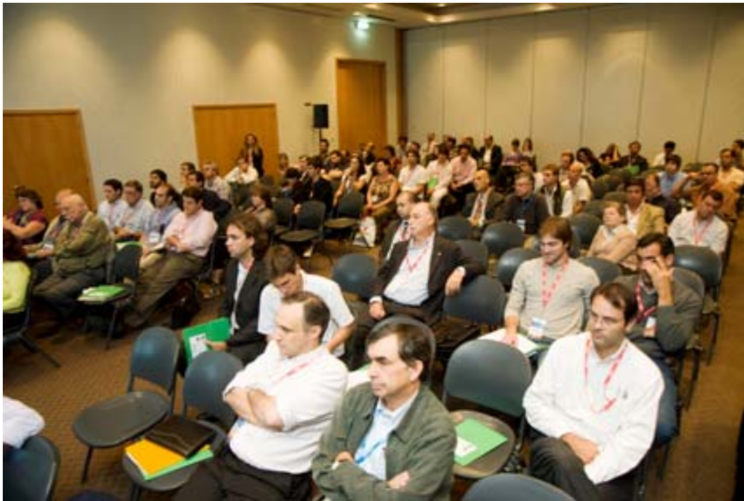
Asistentes al Seminario Internacional Sustentabilidad de los Plásticos. Su contribución al cuidado ambiental